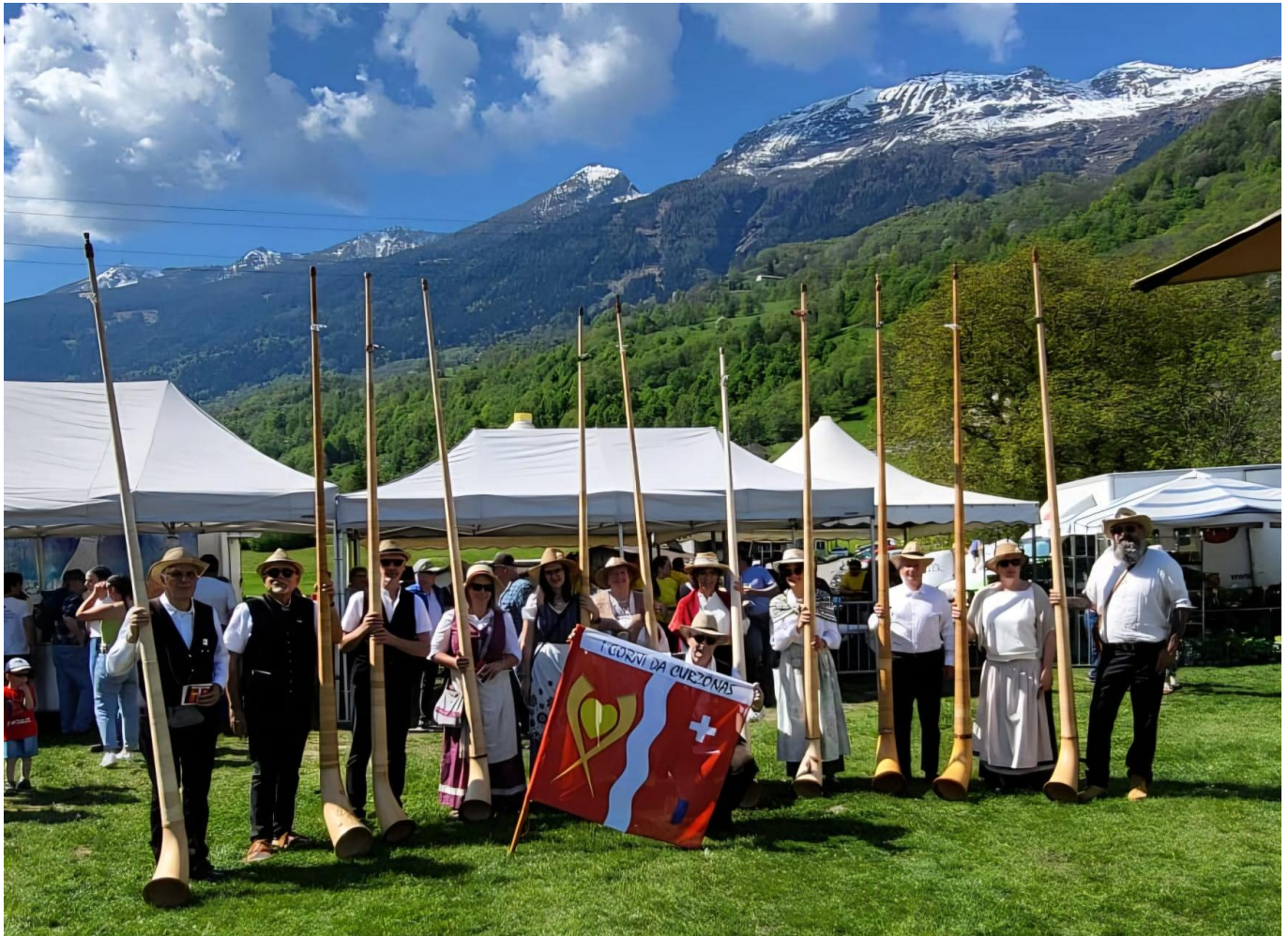
Alphorngruppe „I corni da Corzönas“